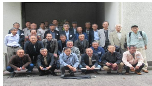
昭和47年機械科卒OBによるOB会翌日でのセンター見学 (令和元年10月17日)