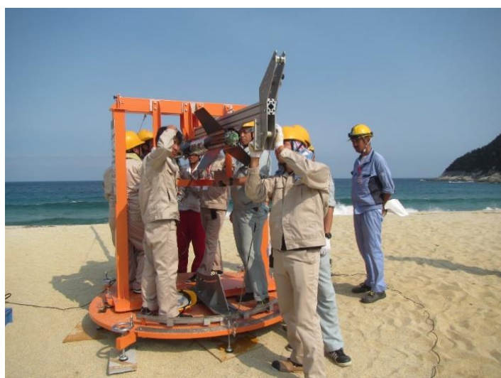
写真1 打上げの準備状況

実験隊は9/9（月）に辺塚海岸へ移動し、午後から砂浜へのランチャー設置と、指令所となったプレハブ小屋への防護壁構築などの事前準備を行った。翌9/10（火）の準備作業中（写真1）に、機体の羽根とランチャーが接触する可能性があることが分かり、打上げを9/13（金）に延期することとした。9/11（水）には海岸でランチャー部材の一部を切断する作業を行った。同時に、実験隊のうち4名は鹿児島大学に戻り、機体の修正作業を行った。9/12（木）にはリハーサルを行い、修正箇所没有问题がないことを確認した。