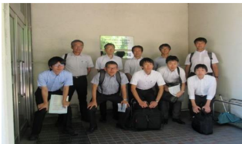
CAE研究会が鹿児島大学ラボツアーの一環として来所 (令和元年10月9日)