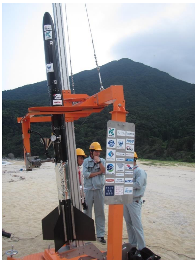
写真 2 打上げ前の機体

この度の小型ハイブリッドロケット初号機の製作に際し、多くの方から奨学寄附金を頂きました。また複数の県内外企業に設計・製作を支援していただきました。打上げ実験の際には、肝付町役場、NPO 法人鹿児島人工衛星開発協議会、一般社団法人きもつき宇宙協議会、多くの県内外企業にサポートしていただきました。紙面を借りて、心よりお礼申し上げます。