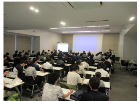
5/29 研究インターンシップ報告会

グローバル人材育成支援室と共催で Global Professional Week 2019 の期間中11月12日(火)に開催。参加者26名の内、B4学生が多数のため、次年度以降の単位化とC-ENGINEの内容を説明。