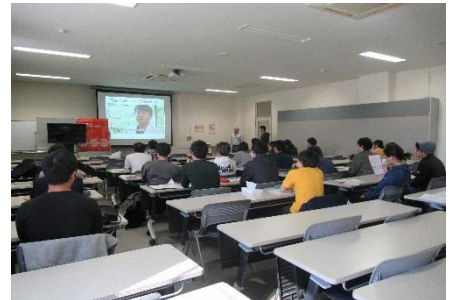
11/12 研究インターンシップ説明会